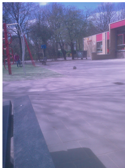
Schoolplein wordt gebruikt