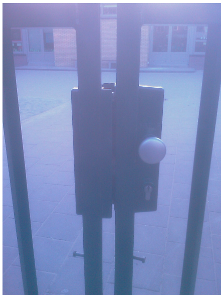
Hek zit op slot

Het toegangshek was afgesloten. (dit is de eerste keer dat ik dit zo aantrof)