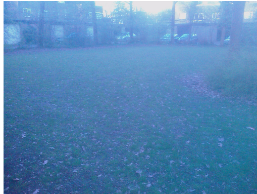
Het aanwezige speelveld/voetbalveldje is niet te gebruiken . Gras is erg dun en het veld is modderig.