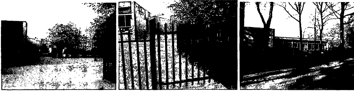
Foto's bij controle 22 april 2009 omstreeks 19.30 - 19.45