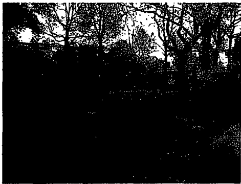
Speelveldje is ongebruikt

Het speelveld (rechts) naast de school wordt niet gebruikt. Wij hebben in de directe omgeving (Groenoord) geen andere speelmogelijkheden geconstateerd voor de leeftijdsgroep die gebruik maakt van het schoolplein. (behalve een pleintje met een wipkip en draaimolentje)