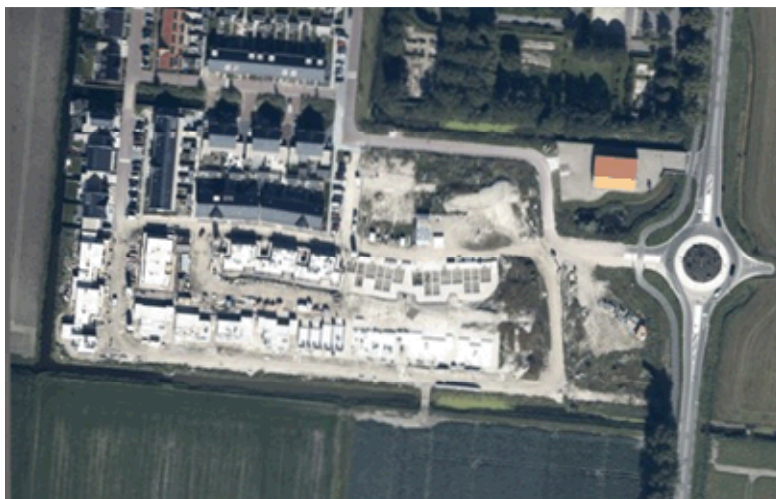
Situatie september 2019