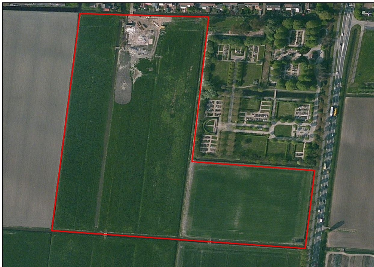
Afbeelding 1: Globale begrenzing projectgebied met een rode lijn

Het projectgebied bestaat uit weilanden en sloten die gelegen zijn in Hazerswoude-Dorp. De precieze begrenzing is weergegeven op afbeelding 1. In Bijlage 1 is de regionale ligging van het projectgebied weergegeven.